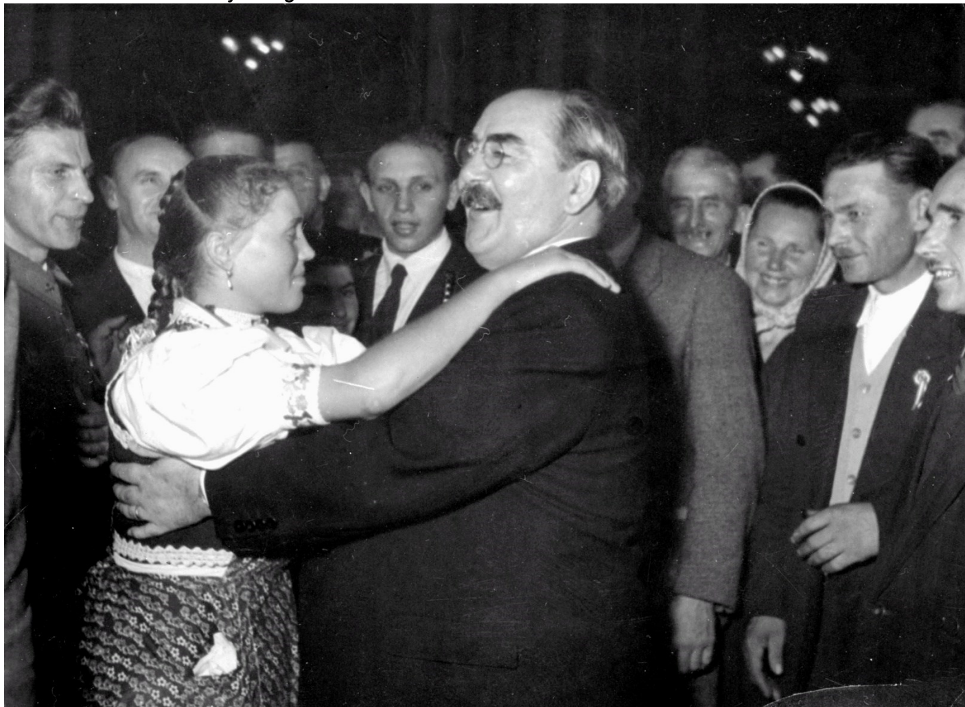
Nagy Imre, a Minisztertanács elnöke egy népviseletbe öltözött fiatal nővel táncol, 1954

Elmondta, hogy Nagy Gáspár Nagy Imrével kapcsolatos versének megírásában jelentős szerepe volt annak, hogy Nagy Gáspár Zala megyei szülőfalujában a Nagy Imre-kultusz sokáig élt. Nagy Gáspárnak számolnia kellett azzal, hogy egy kis példányszámú folyóiratban megjelenő ilyen vers széles körben olvasott lesz és elmarasztalását vonhatja maga után”.